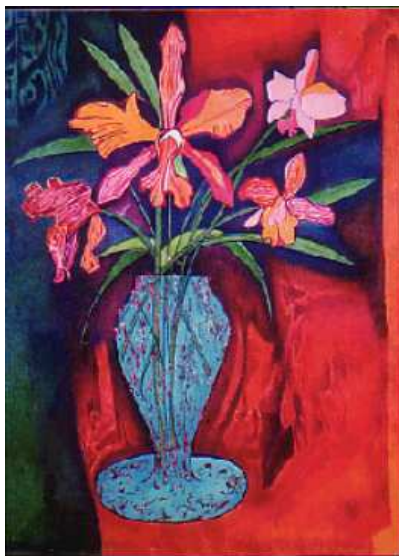
“FIORI” 1998 - 1999

В 2000 году (год Ювилея) они написали картину "ЛУКС" – "LUX" которая была передана Папе в Риме (Папа - Ян Павел Второй).