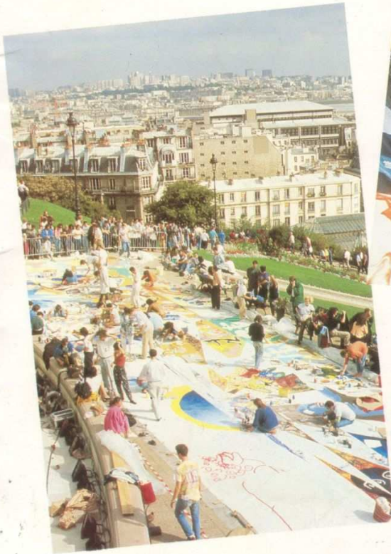
Les artistes au travail...