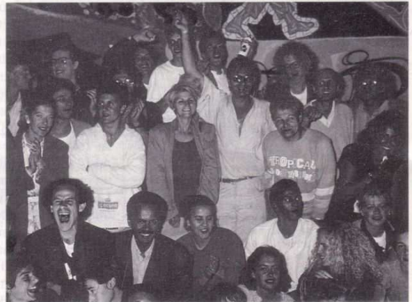
Des artistes heureux...