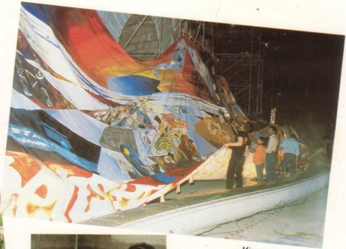
Mise en place de l'œuvre...